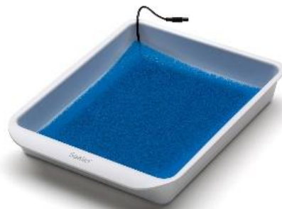
Wannenset als Gegenelektrode